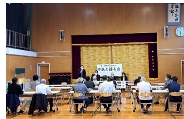
市民と語る会 (二宮コミセン)