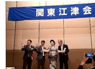
関東江津会総会 (東京)