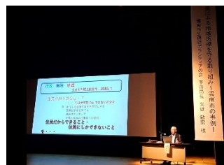
地域医療講演会 (江津市総合市民センター)